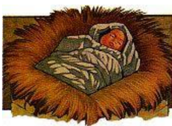
旧約聖書に書かれている 125 以上のメシヤに関する預言は、イエスによって成就した。