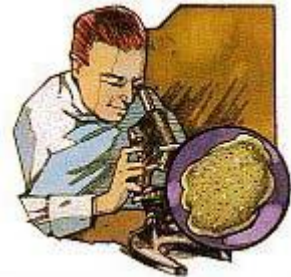
真の科学は常に聖書と調和している、なぜなら神がこの二つの創造主だからである。

3. 近年の科学的計測において、これまでのグランド・キャニオンの地層によって特定された年代とは非常に異なる年代が特定されてきており、進化論者たちと彼らの以前になされた計測は、無鉄砲で無責任なものであるとみなされるようになってきています。人間や類人猿は、共通の祖先を持つとされる無神論者の進化説は、人間は神のかたちに似せて創造されたとする概念を軽蔑するものです。それはまた神の存在を否定し、救い主なるイエスを完全に否認し、聖書を無効にする教えです。人間の救済計画に対する信用性を破壊する進化論説をサタンは非常に好みます。共産主義者たちはそれを学んでいます。私たちはどうでしょうか？