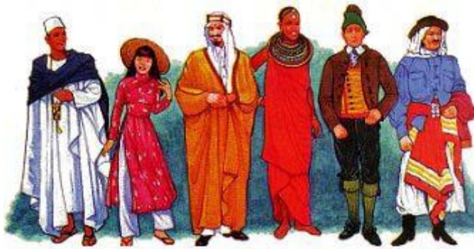
聖書は普遍的な、人の心を引き付ける魅力を持っている。なぜなら、それは人生の最も当惑する疑問に対する明白な回答を与えてくれるからである。