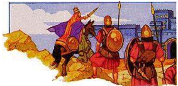
クロスが生まれる前に、神の聖書の預言者は、彼をバビロンを征服する軍将として名をあげている。