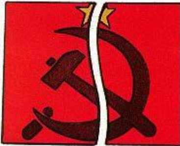
共産主義が崩壊したとき、人々は、唯一の望みとして聖書を支持するようになった。

答え：共産主義の崩壊と、進化論の弱点や矛盾によって、聖書が注目されるようになりました。