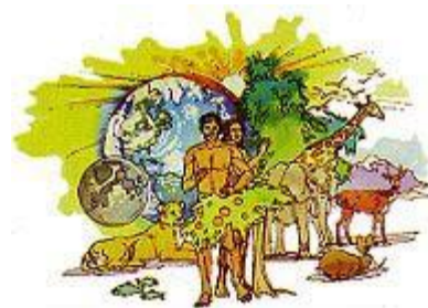
聖書は、地球が字義的な 6 日間で創造されたと教えている。