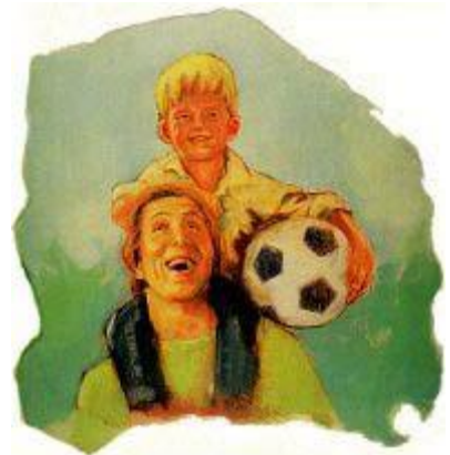
クリスチャンに他の人が所有していない平和および内面の喜びがある。

らはすでに証明されているのだと言いました。その老人はにっこり微笑んで、「私の友よ、私たちがこの本を読んで信じていることを感謝しなさい。そうでなければ、あなたは私たちの今晚の食事になってしまうところでしたよ」と言いました。確かに、聖書は人々を変え、聖書の持つ靈感の力を証しています。