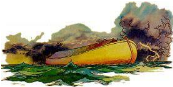
旧約聖書の中の創世記のノアの洪水の記録こそは、考古学者たちが探し求めている解答である。

永遠に存在し、すべてを知られる神は、私たち自身では決して解くことのできない事実があることを認められ、上記の三つの真理を示してくださいました。私たちが現在知っていることは「一部分」に過ぎません（コリント人への第一の手紙 13:9）。そして神の知恵と知識は「窮めがたい」ものです。ローマ人への手紙 11:33。進化論者たちは、この地球の年齢を知ることは決してできません。なぜならアダムとエバを大人として創造されたように、この地球も完全な形で創造されたからです。アダムとエバの人生においての二日目はたったの一日歳でしたが、彼らは完全な大人でした。限りある人間の常識や知恵、知識では完全に創造された地球や人間の年齢を計ることはできません。このような場合、人間の知恵は信用できるものではありません。聖書を信じましょう、そうすることであなたは、一般学者の推論やこの世の知者に常に勝る者となるのです。