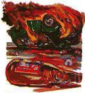
アルコールを断ち切ることを拒むことが、多くの人々に計り知れない苦悩をもたらした。