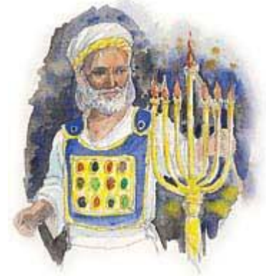
旧約聖書の時代、什一は、祭司たちに支払うために用いられた。

答え： 旧約聖書の時代、什一は、祭司たちの収入として用いられました。レビの部族（祭司たち）は、ほかの11の部族が受けていたような作物を育てるための土地や、事業活動のための割り当てはありませんでした。レビ人は、全時間、宮の務めをなし、神の民に奉仕するための働きをしていました。このような理由で、祭司たちとその家族を什一で支えることが神のご計画であったのです。