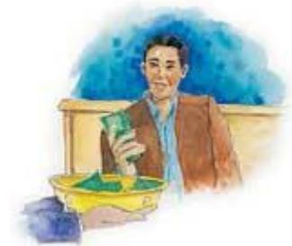
今日、什一は神の働き人たちの給与として用いられている。

答え： 神はこのご計画を続けられました。今日においての神のご計画は、福音の働きにのみ専念している人々を支えるために什一を用いることです。もしすべての人々が什一を献げ、福音伝道者たちを支えるために厳格に什一が用いられるならば、終末時代における神の福音のメッセージを、全世界に迅速に伝えるための十分な資金となることでしょう。