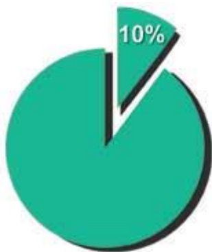
「什一」という言葉は「十分の一」という意味である。

「わたしはレビの子孫にはイスラエルにおいて、すべて十分の一を嗣業として与え」「わたしはイスラエルの人々が供え物として主にささげる十分の一を、レビびとに嗣業として与えた。」民数記 18:21,24