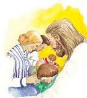
主に自分自身を捧げることが、私たちの最も優先すべきことである。

私たちは、すでに神のものである什一をお返しします。私たちは、献金を おささげします。献金は自発的に、喜んでささげるべきです。