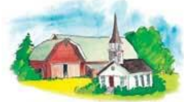
什一は、神の倉である教会に携えていくべきである。