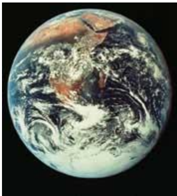
主は世界とその中の全ての物を所有しておられる。