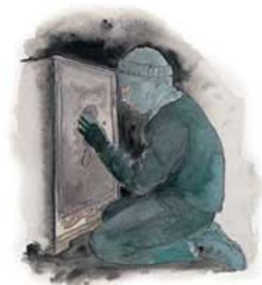
什一と献げ物をしない人々を、神は盗人とみなされる。

答え：神はそのような人々を盗人とみなしておられます。人々が神から盗んでいるということなど想像できますか？