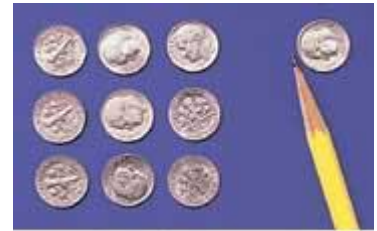
収入の十分の一は神のものである。