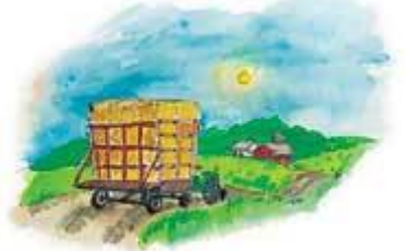
什一を忠実に献げる人たちに、神は、あふるる恵みをあなたがたに注ぐと約束されている。

答え： 神は、「わたしを試み」、そして「わたしが天の窓を開いて、あふるる恵みを、あなたがたに注ぐか否かを見なさい」と言っておられます。神がこのような提案をされるのは、聖書の中ではこの一度だけです。神は、「試してごらんなさい、大丈夫、あふるる恵みを約束するから」と言っておられるのです。世界の何百、何千という什一を献げている人々が、神の什一に関する約束の真理を喜んで証してくれることでしょう。彼らは皆、「私たちがどれほど神にお捧げしても、神が与えてくださるよりも多くのものをお捧げすることができない」というみ言葉の真理を体験しています。